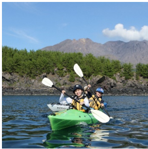
[桜島のアクティビティ]