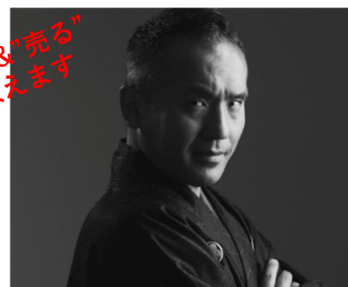
第1回：オンライン登場 第3回/4回：リアル登場