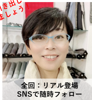
今回：リアル登場 SNSで随時フォロー