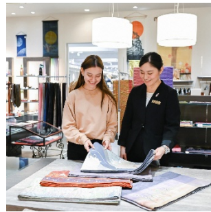
[特産品に関する体験]